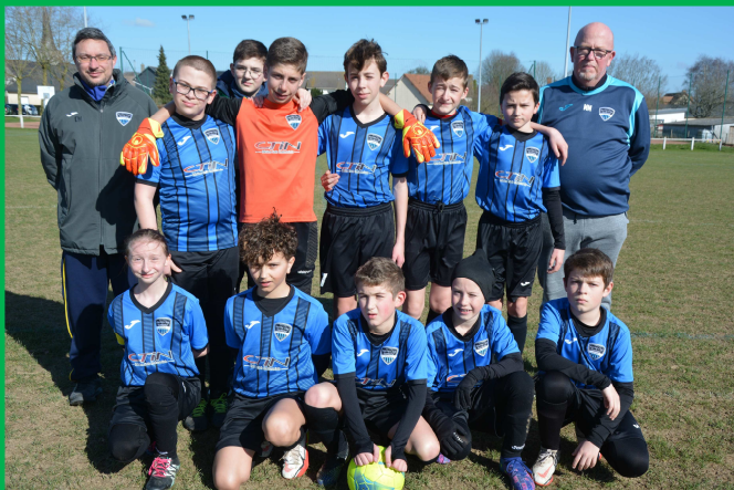
Equipe U13 A lors du plateau Coupe Pitch