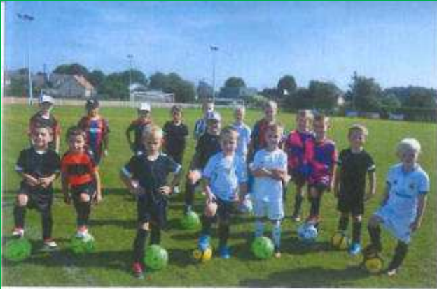
Le groupe des u7 & des U9