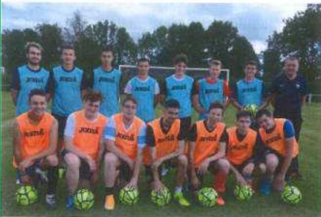
Les U 18