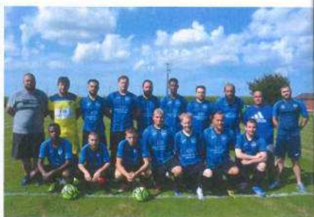
L'équipe 1 ère seniors