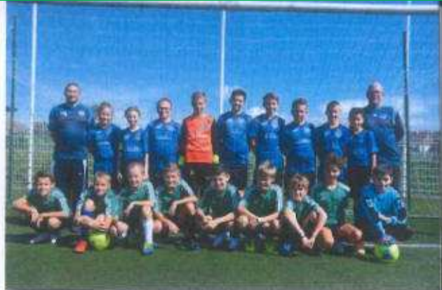
Les 2 équipes U13