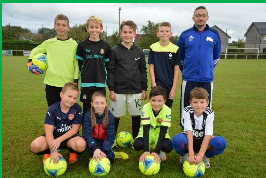
L'équipe des U13