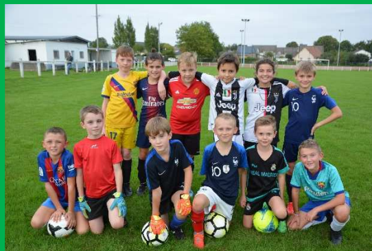
Le groupe des U11