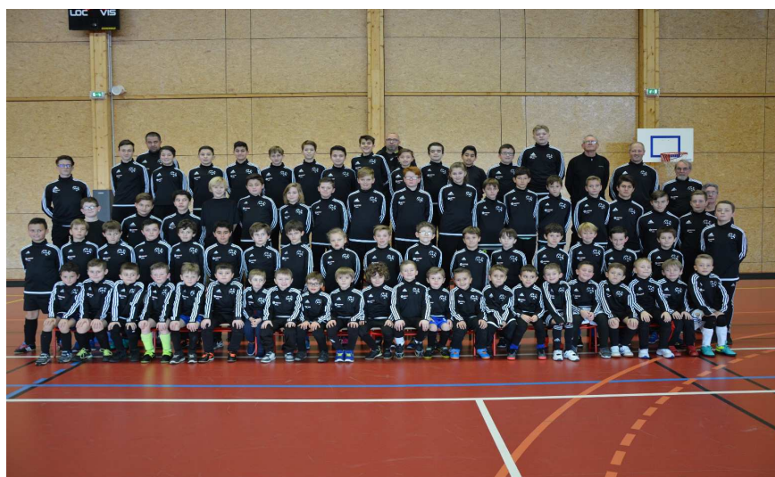
Février 2017 – Ecole de foot équipée de sweats Marché U – Bolbec