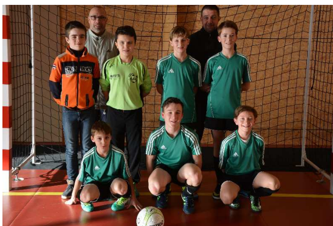
Février 2017 - Equipe U 13 lors du championnat Futsal