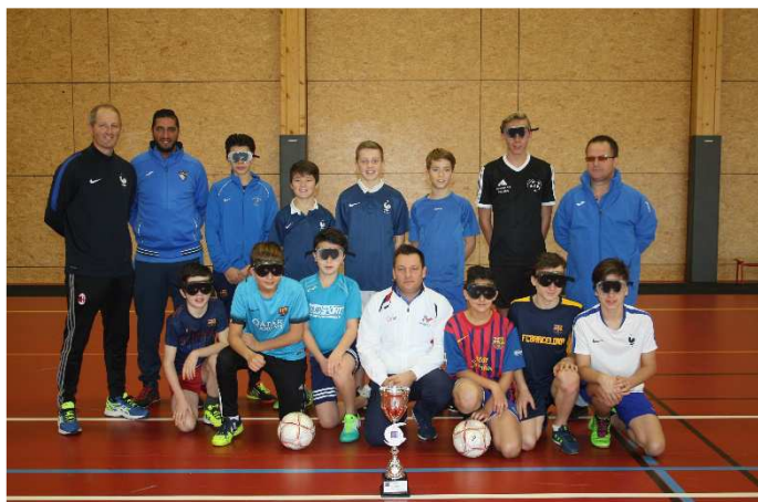
Décembre 2016 – Stage avec la Coupe d'Europe Cécifoot

Chez les seniors, beaucoup de travail en perspective pour atteindre l'objectif du maintien en excellence.