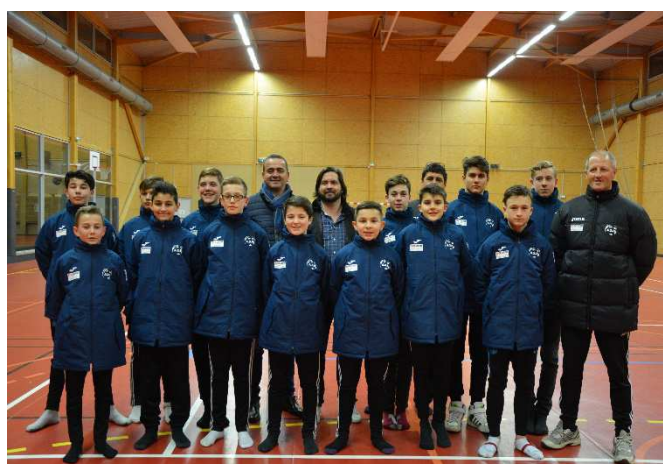
Mars 2017 – Remise équipements Eco cuisine Gonfreville