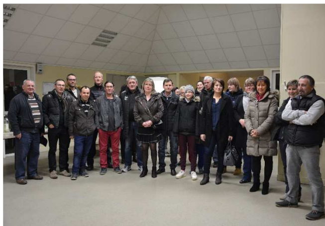
Janvier 2017 - Réunion des partenaires & des dirigeants