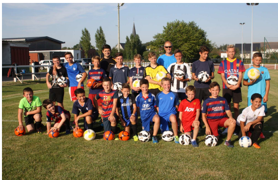
La nouvelle équipe des U15