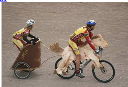
Course de vélo-char

1991 – 2016 : 26 ans de Téléthon à Beuzeville